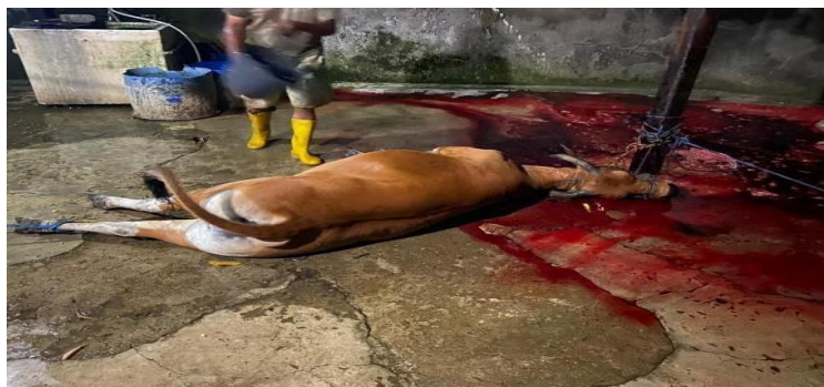
Gambar 1. Limbah pemotongan hewan

Dari penelitian penulis melihat langsung kegiatan pemotongan hewan di TPH Amessangeng menghasilkan limbah berupa darah, isi saluran pencernaan, dan sisa hasil pencucian lainnya. Limbah tersebut tercampur menjadi satu dibuang melalui saluran selokan. Limbah isi pencernaan dikelola supaya tidak menumpuk di saluran selokan dengan cara dibuang tidak secara bersamaan tetapi sedikit demi sedikit dan disertai dengan penyiraman air yang banyak sesuai dengan Saluran pembuangan TPH berfungsi dengan baik, sehingga limbah hasil pemotongan akan langsung mengalir keluar dari ruangan pemotongan hewan sesuai dengan Gambar 1