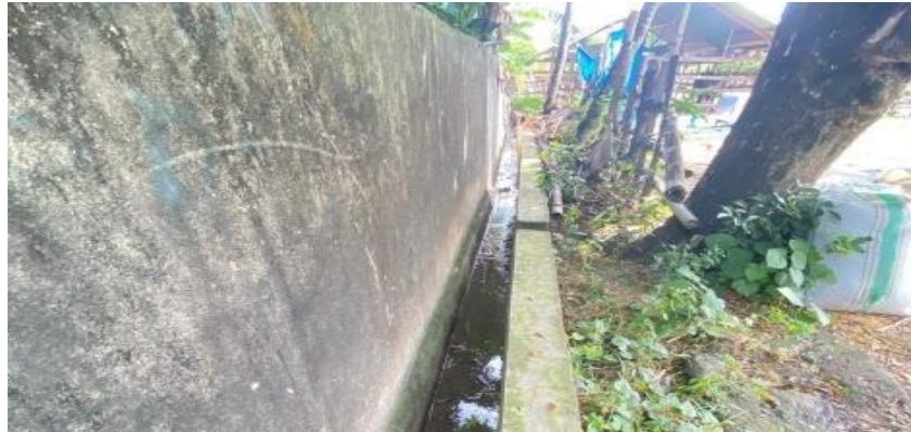
Gambar 3. Kondisi selokan di luar ruangan pemotongan hewan

Setelah keluar dari ruangan pemotongan ukuran selokan menjadi lebih lebar, sehingga mampu mengalirkan limbah dan air lebih banyak dan mencegah terjadinya penumpukan limbah seperti pada Menumpuknya limbah peternakan sampai dengan kapasitas tertentu akan menimbulkan dampak negatif antara lain berupa peningkatan populasi mikroba patogen sehingga mengakibatkan terjadinya pencemaran air, tanah dan pencemaran udara karena debu infeksius serta bau yang kurang sedap (Indawati, masyarakat Amessangeng .(Wawancara 15 Oktober 2022).