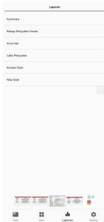
Gambar 2. Tampilan Aplikasi E-Nota UMKM Aneka Kasur Ibu Halimah

Kegiatan pendamping pembuatan aplikasi E-Nota digital ini langkah-langkahnya sebagai berikut: