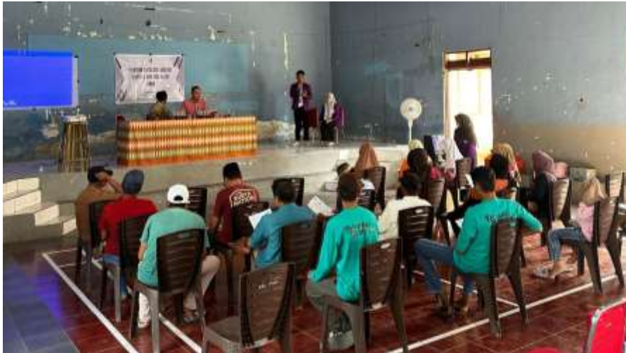
Gambar 3. Pelatihan dan Pendampiangan